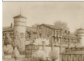
L'ABBAZIA DI ACQUALUNGA